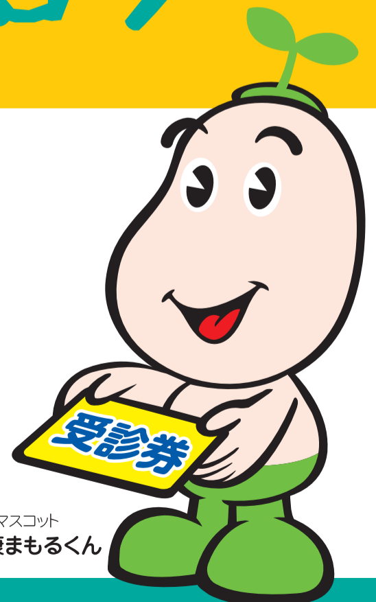
国保マスコット 健康まもるくん

各会場・医療機関では、 消毒・三密を避けるなど、 適切な感染対策を行っています。